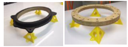
使用例 インナーバッフル塗装