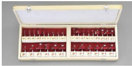
6. 0mm軸 軸長 30mm